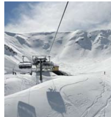
Impianti del Cimone

Politiche a sostegno del sistema agricolo come elemento di sviluppo economico e di tutela del territorio; valorizzazione del turismo e delle opportunità legate ai prodotti enogastronomici.