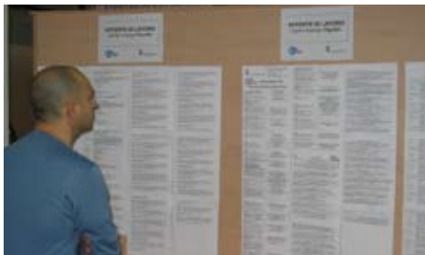
L'interno di un Centro per l'impiego