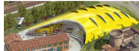
Progetto del museo "Casa natale Enzo Ferrari"

Un progetto integrato di marketing territoriale che valorizzi le due identità forti del territorio: "Terra di motori" e il patrimonio agroalimentare. Promozione del turismo in Appennino e dei circuiti dei castelli e dei musei.