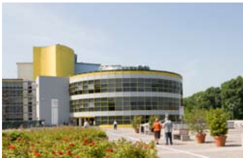
Il nuovo ospedale di Sassuolo

Apertura dei nuovi ospedali di Baggiovara e Sassuolo e potenziamento della rete di servizi ospedalieri in tutta la provincia; servizi domiciliari cresciuti del 23% in 5 anni; quasi dimezzato il numero di vittime di incidenti stradali.