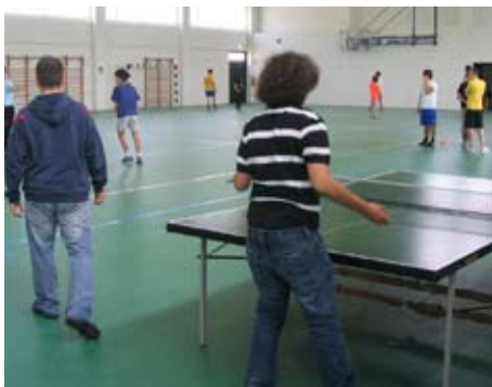
La palestra dell'Itis Vinci a Carpi

Consolidare la rete ospedaliera per arrivare a una completa integrazione di Policlinico Universitario e ospedale di Baggiovara – Potenziamento delle politiche di prevenzione e assistenza domiciliare; creazione di soluzioni per i ricoveri di “solievo temporaneo” per le famiglie e la natalità; riqualificazione del sistema di welfare per estendere l’offerta.