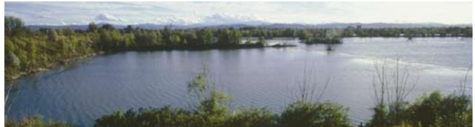
Le casse di espansione del Secchia

Si punterà su uno sviluppo di qualità, politiche di risparmio energetico, miglioramento dell'aria, potenziamento della raccolta differenziata e del porta a porta.